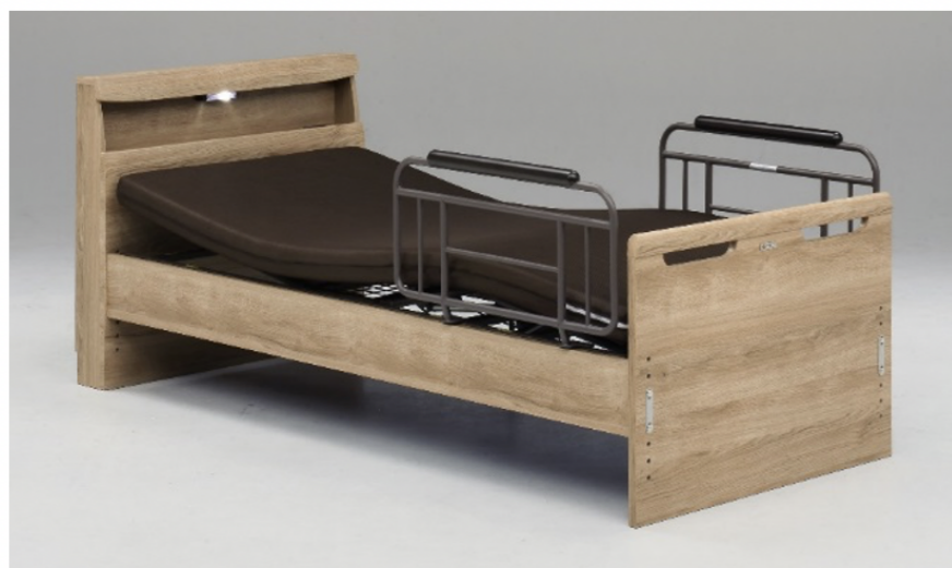
キャビネットタイプ NA(ナチュラル)