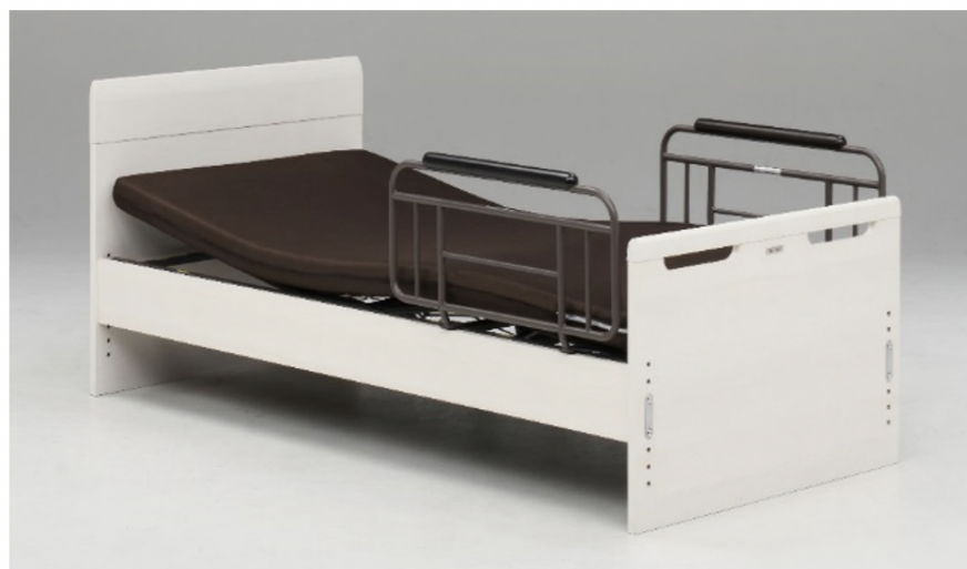
フラットタイプ WH(ホワイト)