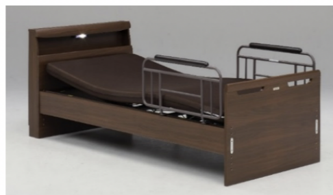
キャビネットタイプ BR(ブラウン)