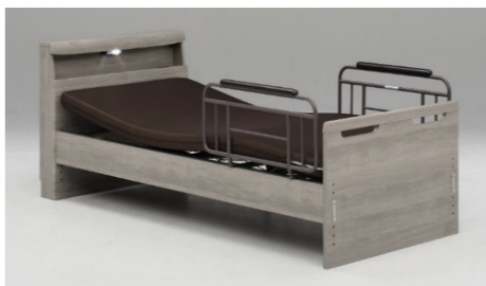
キャビネットタイプ GYB(グレイージュ)