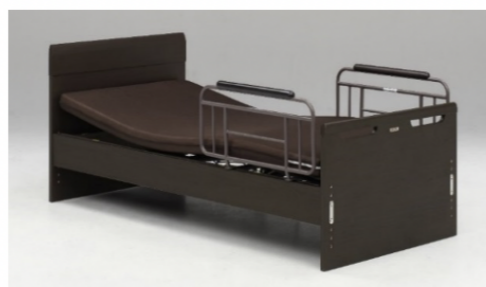
フラットタイプ DB(ダークブラウン)